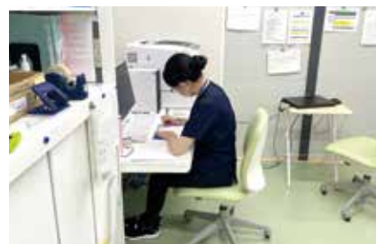
薬剤師部屋での業務の様子