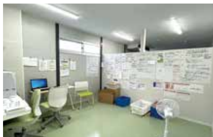
臨時医療施設の薬剤師控室

派遣に行くまでは2年目の私で務まるか不安でしたが、東京病院の職員をはじめ、臨時医療施設内で働く医師や看護師、同じ期間に勤務をしていた薬剤師の先輩方に教えていただきながら、1週間の勤務を終えることができました。持参薬鑑別や医師への処方提案、医師からの相談対応などは普段よりも多く経験できたので、今後の業務にも活かしていきます。