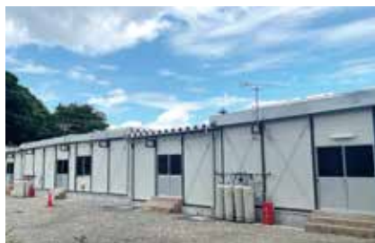
臨時医療施設の外観