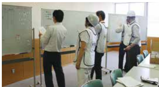
災害対策本部での様子

平成 31 年 3 月 26 日に山梨県震度 6 強を想定した災害対策訓練を行いました。院内における傷病者の受入れ体制、ライフラインの確認、災害対策本部の設置など、一連を通じた訓練を行いました。訓練後は、国立病院機構渋川医療センター事務部長にお越しいただき「病院 BCP と災害マニュアル」と題した講演をしていただきました。