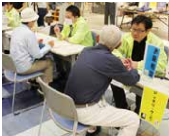
お薬・栄養相談の様子