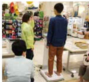
インボディ測定の様子