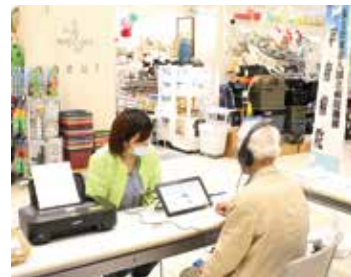
脳活チェックの様子