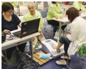
骨密度測定の様子