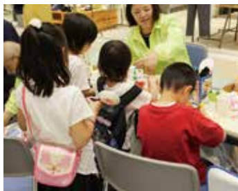
療育指導室による制作コーナー