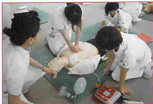
実践：指導者のもと、心臓マッサージ訓練中

6月に入り、2ヶ月ぶりに新人さん全員が研修で集まりました。就職3ヶ月目に行う研修は、救命救急トレーニングです。人数の少ない夜間勤務時に、患者さんの緊急事態があっても対応できるように、この時期実施します。この研修で、心臓マッサージ、人工呼吸、AEDの操作について、知識と技術を学びました。