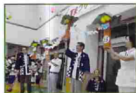
趣向を凝らした、各病棟の手作りのみこしも登場