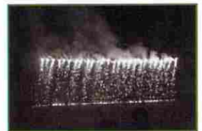
クライマックスは花火!