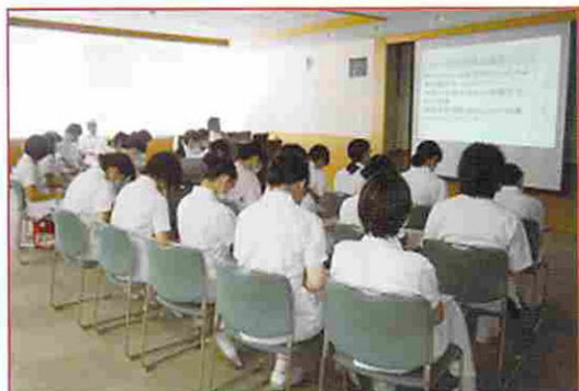
原藤副看護師長による救命救急講義

新人さんが就職し3ヶ月が経ちました。日中の勤務がひとりできるようになり、夜勤をするようになりました。まだまだ夜に働くことが慣れていないので、緊張の連続です。