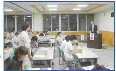
講演終了後の質疑応答