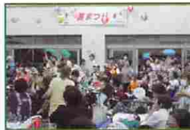
夏まつり・夜の部の様子

昼の部は、フラダンス・ミニ縁日などの催しを行い、夜の部は、北新小学校ブラスバンド部の演奏・病院職員のバンド演奏・甲府チェ