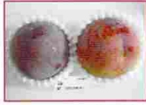
くだもの王様・貴陽

せたのですから間違いありません。とにかく今までのプラムとは月とスッポン、井戸掘りと木登りくらいの差があるのです。