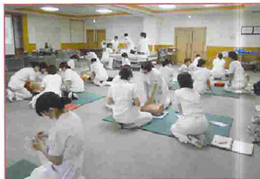
3人1組で蘇生処置中

トレーニングには、練習専用の人形を使用します。本番さながらに声を出し、応援を呼び、蘇生処置を行います。心臓マッサージは、1分間に100回で5cm以上胸を押さないと効果がありません。心臓を押す位置とリズムと深さを体得するために、1時間半の間、心臓マッサージの練習をやり続けましたから、新人さんは汗だくで腕も腰もぼんぼんになりました。人形も、何百回と心臓を押されましたが、表情も変えずに耐えてくれました。いい汗かきましたね。