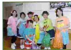
大活躍! 甲府チェリース

当日は雨天のため室内での実施となりましたが、花火の頃には雨も止み、最後は外で花火を楽しむ事ができました。