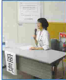
座長をつとめた黒澤医長

講演会には当院職員のほか、近隣の医療機関から医師、看護師、コメディカル等の医療関係者が来場し、太田先生の講演に熱心に耳を傾けていました。