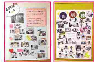
各部門のポスター