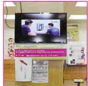
院内のモニターに当院がTVニュースで特集された「甲府市北東地域包括支援センター」の皆さまや当院の関係スタッフ、並びに参加して下さった地域の皆さまに心より感謝申し上げます。

リーンやモニターにポスター展示の映像を映し出し、5月8日にYBS山梨放送「YBSワイドニュース」で放送された当院のスポーツ・膝疾患治療センターの特集「アスリートを支える膝疾患治療最前線」の録画映像も流しました。最後に無料相談でご協力いただいた「甲府市北東地域包括支援センター」の皆さまや当院の関係スタッフ、並びに参加して下さった地域の皆さまに心より感謝申し上げます。