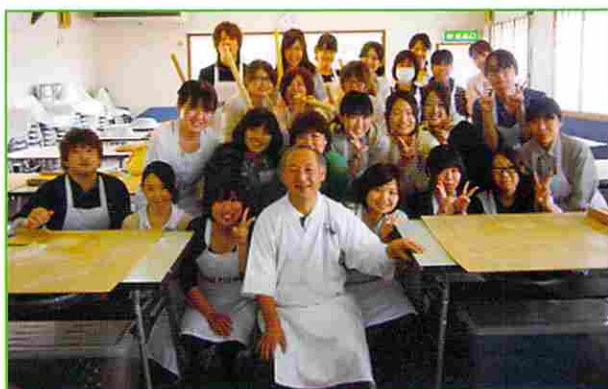
昇仙峡・そば打ち道場「すがはら屋」さんにて。新人みんなで記念撮影。

新人の一生懸命な様子は、周りの刺激になり初心を思い出させてくれます。この研修でできた不安や悩み、喜びは他のスタッフにも伝え、周囲も初心に戻し、フレッシュな気持ちで新人をサポートしていきたいと思