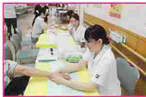
アロママッサージ