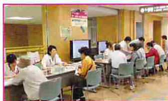
無料相談コーナー(↑) にここ広場(→)