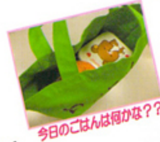
今日のごはんは何か？

ウインナー、唐揚げ、ハンバーグ、卵焼き… みんなが好きなおかずはたんぱく質のものが中心です。 でも、1食に必要なたんぱく質は大人でもMサイズのたまご1個分もあれば十分なのです 好きなおかずばかりあれもこれも…だと栄養のバランスが整いません。 たんぱく質の多い肉・魚・たまご・大豆製品(豆腐・油揚げ等)のおかずばかりでなく、 ごはん：野菜：おかず＝3：2：1を目安に作ってみてください。