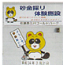
佐渡西三川ゴールドパークのキャラクター