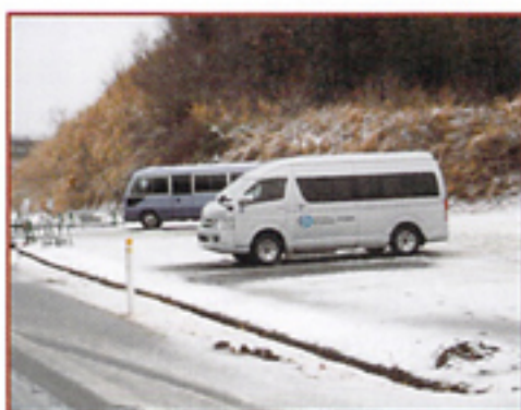
広野インターにて。当日は朝から雪となった。

20km圏外）にて医療班専用車両（車内診察可能）で対応できるように、当院公用車にて看護師2名、事務職員1名で待機