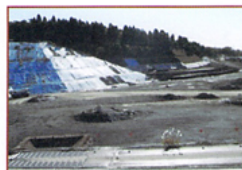
クリーン開発 最終処分場

中間処理施設で焼却された廃棄物の燃え殻は最終処分場であるクリーン開発（愛知県瀬戸市）に運ばれ埋立処理が行われます。廃棄物にセメントを混合することにより、廃棄物自体に耐震性をもたせる日本で初めての埋立方法を導入していました。