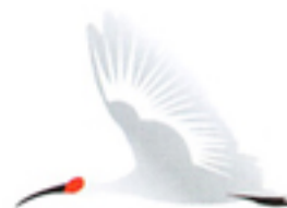
佐渡市の鳥・トキ