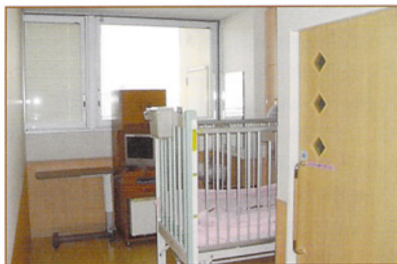
個室タイプの部屋を4部屋用意しております（写真は211号室）

や細菌による感染症ですので、感染拡大を防ぐための隔離や抵抗力が未熟な乳幼児には逆隔離が必要なことも少なくありません。小児科特有の状況のひとつが、この、年齢や疾患の種類、患者さんの病状などによって部屋利用を考えなくてはいけないということです。