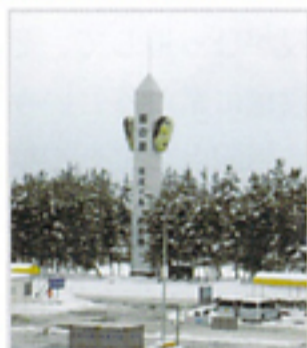
両津港前。能面をあしらったモニュメントタワーがある。

島内には能舞台が33も残されており、私の住む樺尾にも能舞台のある神社があり、次の世代にしっかりと受け継がれ