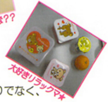
大好きリラックマ★