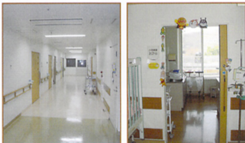
2病棟、211～216号室が新たに「小児科専用病室」となりました（左）専用のスタッフステーションも設置されています（右）

これまで小児科での入院治療が必要な方は、4階病棟の大部屋（4床室）を中心に必要に応じて個室をご利用いただいております。病棟・外来各看護師長を中心に4階病棟での可能な限り最良の入院環境づくりを一同心がけてきましたが、小児科特有の状況のために病室の有効利用には限界があり、ベッド空き待ちや部屋移動などみなさまにもたびたびご迷惑をおかけしました。