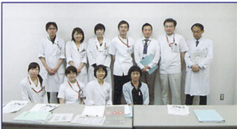
甲府病院 NST委員 (2012年3月現在)