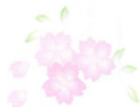
富岡市の花・サクラ