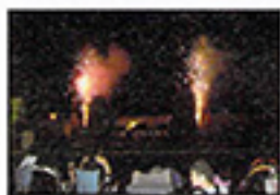
クライマックスの花火

今年度も多くのボランティアや地域の方々の協力により、盛大に夏まつりをおえることができ、誠にありがとうございました。今後も患者様が入院生活の一時を少しでも楽しめるように、病院を挙げて楽しい行事を企画していきたいと思