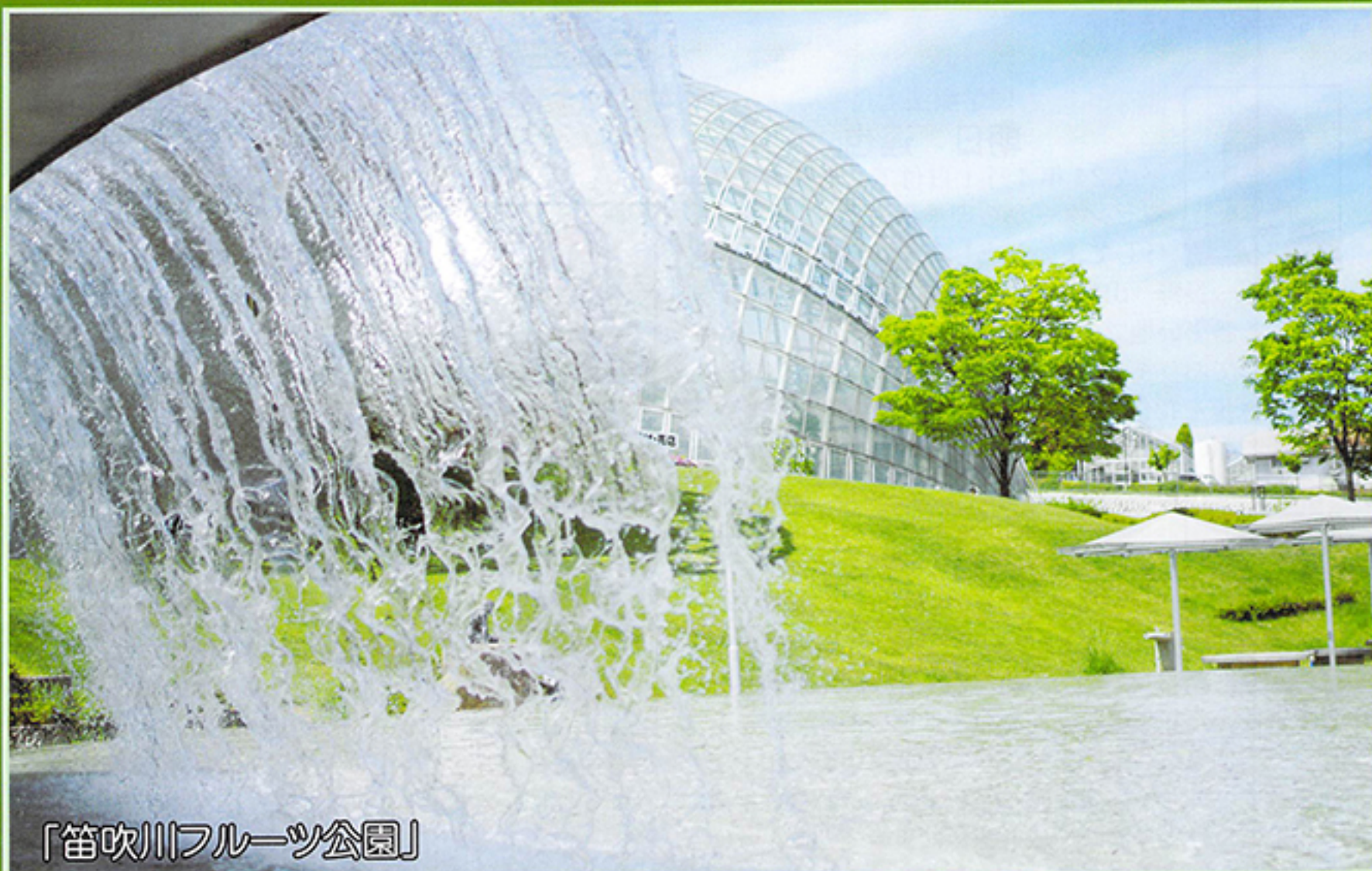
「笛吹川フルーツ公園」

初夏の一日山梨県笛吹川フルーツ公園へ出かけました。公園は甲府盆地を望む高台に位置しており、富士山も眺めることができ、夜景が綺麗で有名です。甲府盆地の夏は暑くて過ごしにくいとされていますが、水の躍動感がある写真が撮れましたので、少しでも涼しさを感じていただけたらと思います。