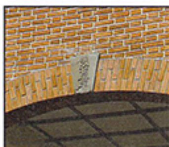
富岡製糸工場・東繭倉庫のキーストーン(要石)。「明治五年」の刻印がある。

日本が近代化に向けて目覚ましい発展を遂げた時代の熱気に満ち溢れた空気に触れることができるかもしれません…。