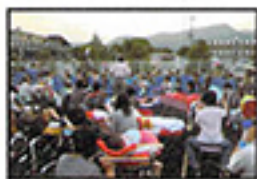
北新小学校プラスバンド

した。昼の部は医療度の高い患者様を対象として各病棟デイルームにて緑日と職員やボランティアによるステージを実施しました。夜の部は療育訓練棟とグラウ