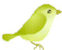
富岡市の鳥・ウグイス