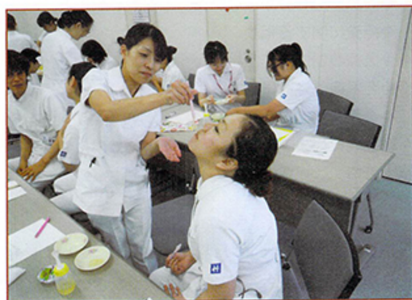
勉強会では、ムセやすい食事姿勢を体験

「食べることを“楽しみ”として感じてくれますように」摂食ケア班メンバーの共通の願いです。