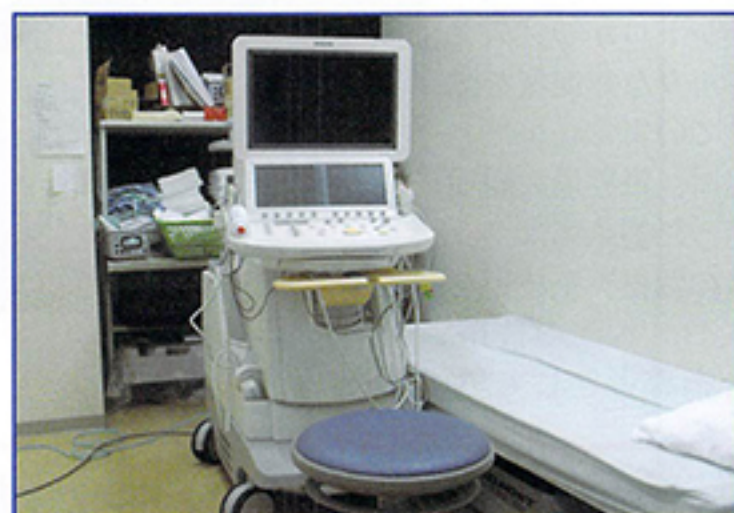
当院において2月より導入した新しい心エコー診断装置 (PHILIPS社製 iE33)

当院では2月より新しい心エコー診断装置が導入されました。以前のものに比べ画像が良く、3Dなど多機能を備えているため、弁膜症をはじめ様々な心疾患の診断や経過観察により一層役立てたいと考えています。