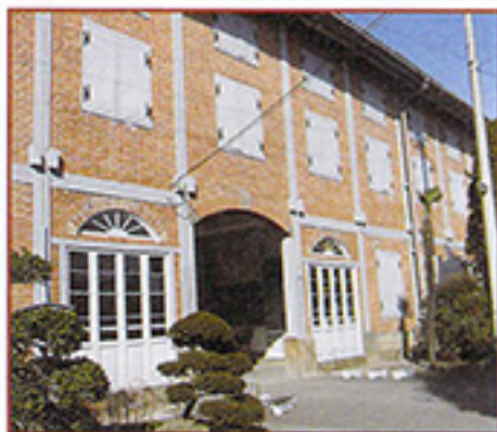
富岡製糸場・東繭倉庫の赤レンガの外壁

当時、世界最大規模を誇った製糸場はフランスの器械製糸技術を導入し、本国の技術者を指導者として招