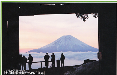
しちめんざんけいしん 「七面山敬慎院からのご来光」

七面山（しちめんざん）は南アルプス連峰に属する標高1,982メートルの豊かな自然が美しい山です。古来より山麓に点在する村々の守護神として山岳信仰の対象となってきました。