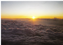
富士山頂より日の出と夕日

医療を取り巻く状況は年々変化しますが、当院の果たすべき役割は引き続き果たすべく、変化に対応して行くつもりです。