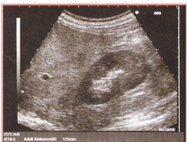
旧超音波診断装置